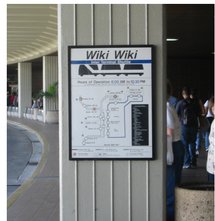
Signalisation Wiki Wiki à l'aéroport international d'Honolulu

Lorsqu'un wiki autorise des visiteurs anonymes à modifier les pages, c'est l'adresse IP de ces derniers qui les identifie ; les utilisateurs inscrits peuvent quant à eux se connecter sous leur nom d'utilisateur.